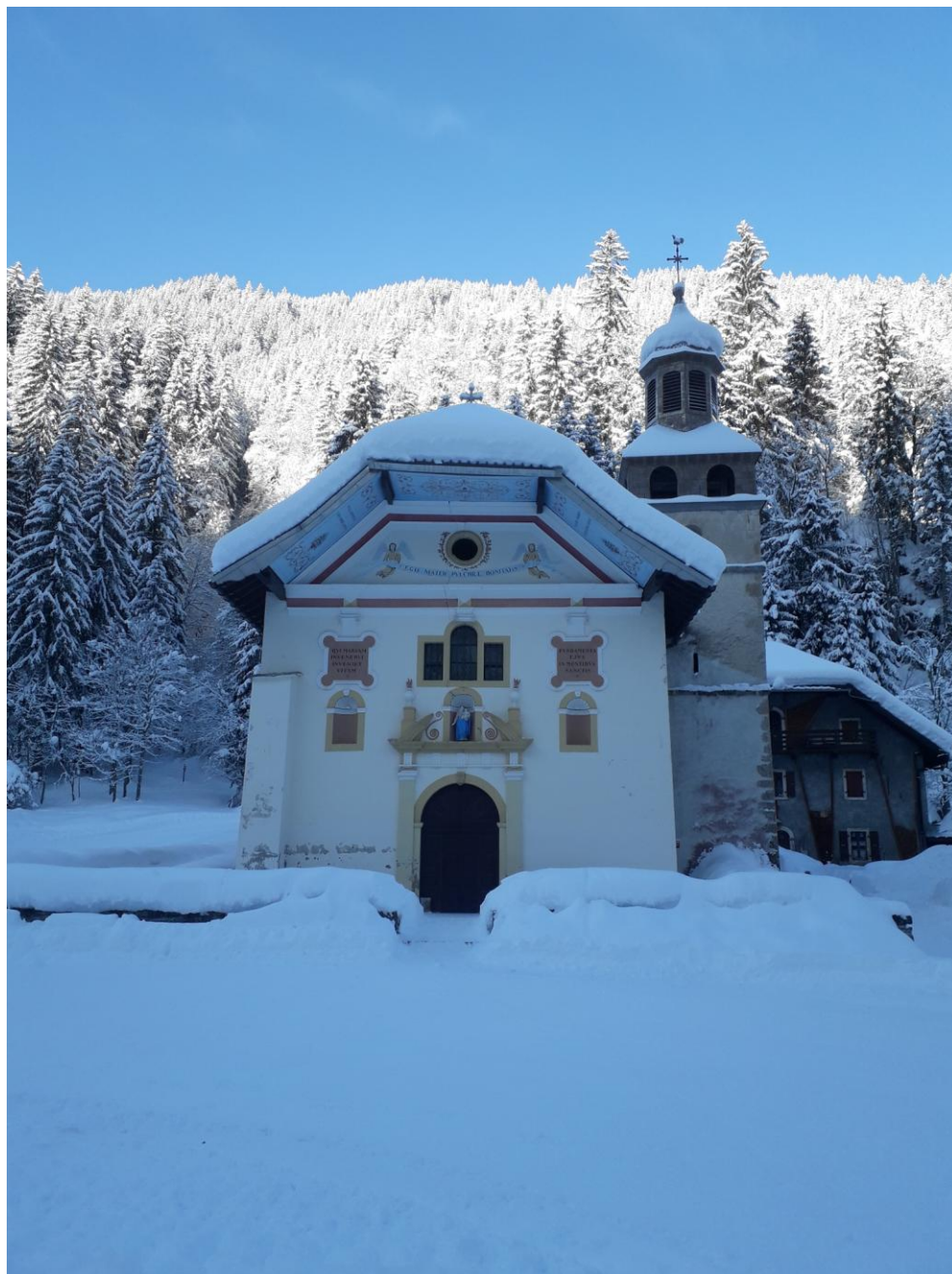
Station Les Contamines Montjoie Haute Savoie